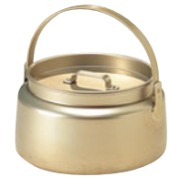
③稀酸アルマイト 汁入缶 ㊦