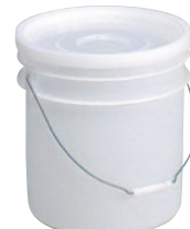
⑧調味液保管容器 サンペール ㊦

内寸:247×247×H240 1197300 ¥5,000 材質:高密度ポリエチレン 容量:10ℓ 耐熱温度:-30℃~80℃