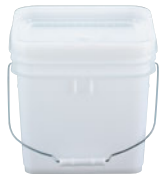
⑦トスロン 角型 密閉容器

材質:高密度ポリエチレン 耐熱温度:4ℓ(-20℃~60℃) 12, 20ℓ(-30℃~80℃)