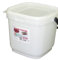
⑫PE密封容器 パッカー ㊦