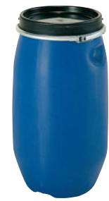
⑬サンコー プラスチックドラム ブルー 25L-1 ㊦

外寸:φ296×H521 8147300 ¥7,050 口径内寸:φ239 容量:25ℓ 重量:1.75kg 材質:超高分子量PE ●耐薬品性、耐油性に優れ、錆も出ません。 ●蓋はバッキング付で、締め金具との併用により、内容物の漏れの心配はありません。 ●液体食品、穀物の保存用として最適です。