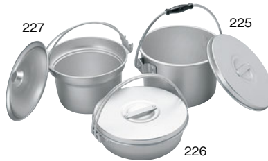
②アルマイトジャム・バター入 ㊦