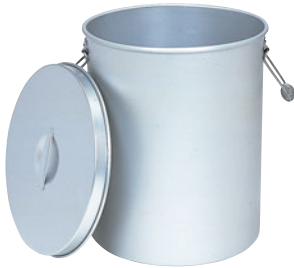
①アルマイトお茶タンク 250-T ㊦