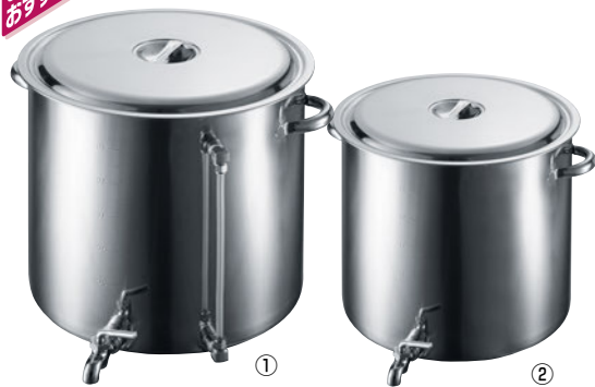
蛇口径約25mmの太口蛇口の為、細かいカスがつまりません。