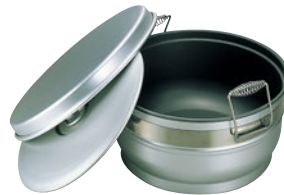
⑤アルマイトスミフロン 二重食缶(お椀型) ㊦