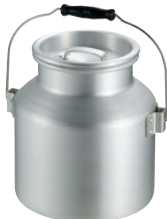
④アルミ スープ運搬缶