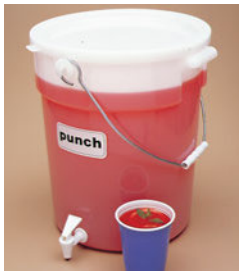
⑩キャンプ ビバレッジディスペンサー DSPR-6

内寸:233×233×H406 8037300 ¥5,823 容量:18ℓ 材質:ポリプロピレン 耐熱温度:-10℃~80℃