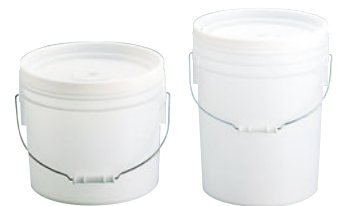
⑥トスロン 丸型 密閉容器