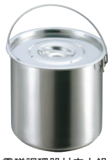
電磁調理器対応内鍋